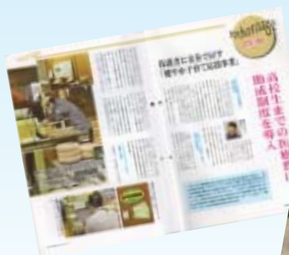
広報誌『北海道の国保』