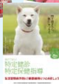
国保啓発用ポスター